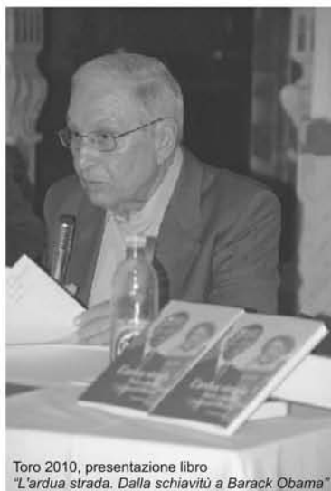
Toro 2010, presentazione libro "L'ardua strada. Dalla schiavitù a Barack Obama"