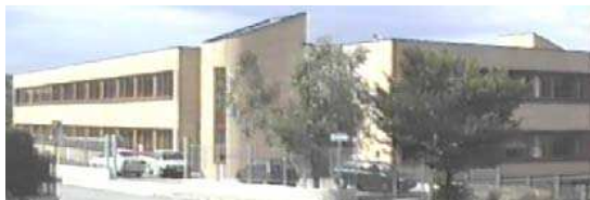
Istituto Comprensivo "G.A. Colozza"