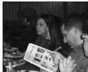
Il Circolo augura un felice anno nuovo a tutti